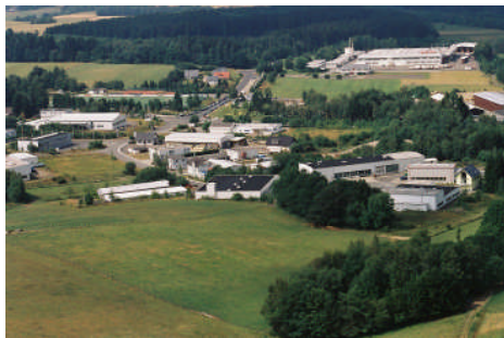
Blick auf das Industriegebiet Hünsborn Süd-West

Seit einigen Jahren ist die Gemeinde Wenden bemüht, Ihren Bedarf von rund 16 ha Gewerbe- und Industriefläche unterzubringen. Große Hoffnung hat man da in die Erschließung eines interkommunalen Gewerbegebietes gemeinsam mit der Stadt Kreuztal auf der Ostheldener Höhe (Landhecke) gesetzt und tut dies immer noch. Mitentscheidend für die Realisierung der „Landhecke“ ist, ob die Kosten für die Anbindung eines solchen Gewerbegebietes an die HTS/A45 vom Land getragen werden oder nicht.