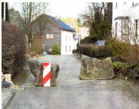
Bild oben: Blick von der Hochstraße Richtung Malteser- / Dreikönigsstraße

Nachdem Unterschriftenlisten für und gegen die Aufrechterhaltung der Sperrung bei der Gemeindeverwaltung eingingen, haben die CDU-Ortsunion und die CDU-Ratsmitglieder aus Hünsborn Gespräche mit den Anliegern beider Interessenlagen gesucht. In dem zuständigen Ausschuss des Gemeinderates wurde durch Antrag der CDU-Ratsmitglieder die Gemeinde beauftragt, einen Plan für eine dauerhafte Lösung der Einmündung Malteser- /Hochstraße und deren Anbindung an die Dreikönigsstraße zu entwickeln.