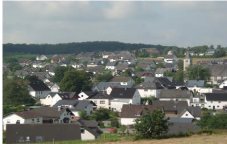
Eine Impression der Ortschaft Altenhof

Auf dem CDU-Sommerfest in diesem Jahr gab's erste Gespräche zwischen den Vorständen der CDU-Ortsunion Altenhof und Hünsborn über eine engere Zusammenarbeit in Zukunft. Die Vorstände werden sich hierzu beraten und möglicherweise auf den nächsten Mitgliederversammlungen der beiden Unionsnachbarn, die Vorschläge den Mitgliedern präsentieren.